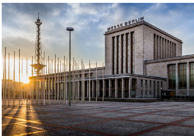
Messe Berlin – in nur 10 Minuten Fahrtzeit sind Sie bei Berlins größtem Messegelände Messe Berlin – in just 10 minutes you are at Berlin's largest exhibition center

U-Bahnhof/Underground „Bismarckstraße“ ..... 140 m