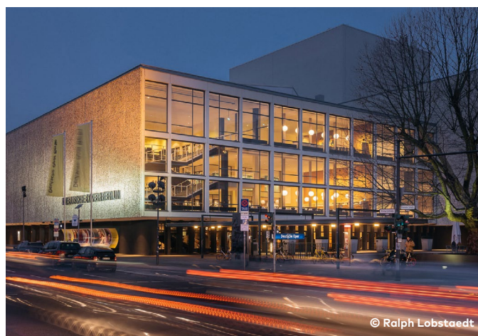
Für Kulturbegeisterte ist die Deutsche Oper nur 5 Minuten Fußweg entfernt. For culture enthusiasts, the Deutsche Oper is only a 5 minutes walk away.